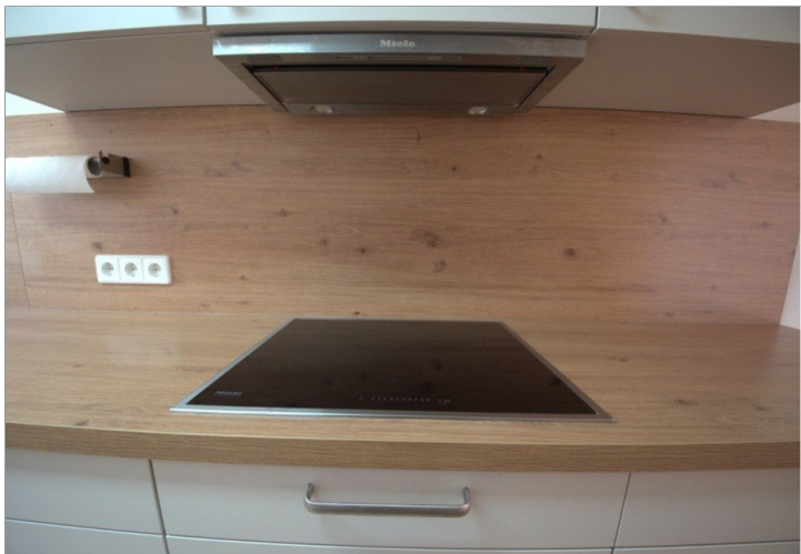
Herd mit Dunstabzug