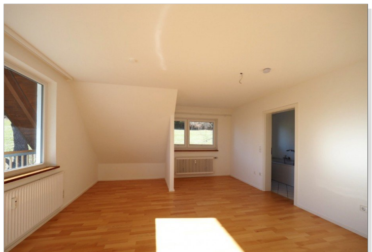
Schlafzimmer mit Tür ins Bad