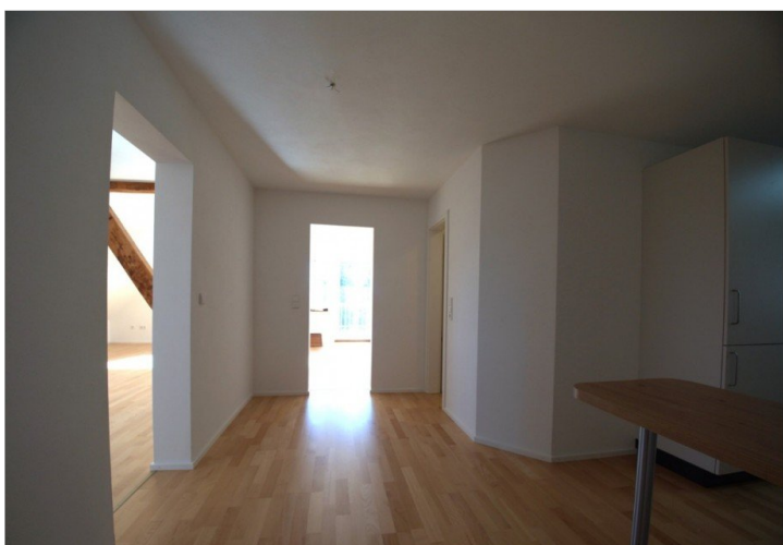
Diele Richtung Wohnzimmer