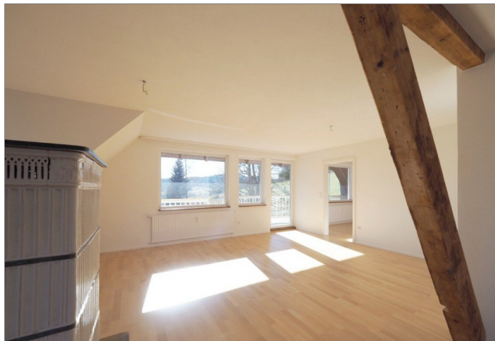
Wohnzimmer mit Balkonzugang