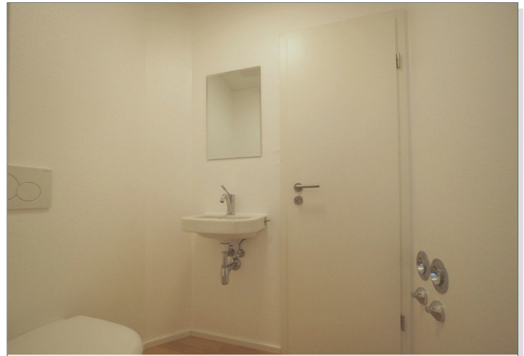
Gäste-WC mit Tür zur Diele