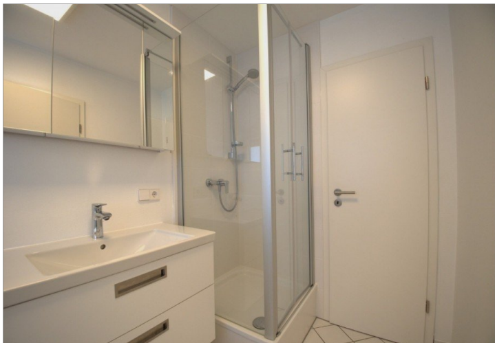
Bad mit Tür ins Gäste-WC