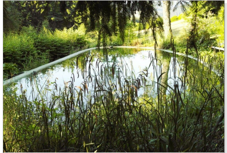
Eine kühle Oase