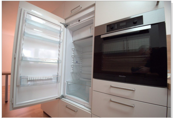
Backofen und Kühlschrank