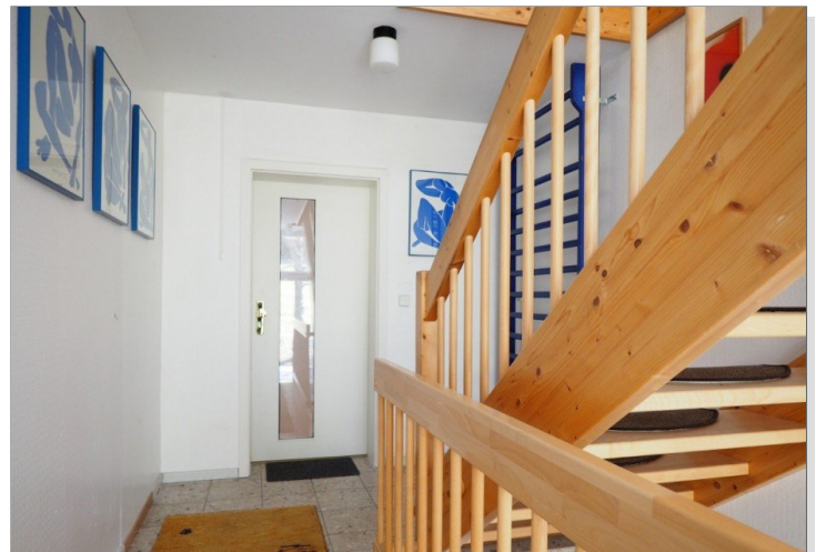
Treppenhaus mit Wohnungseingang