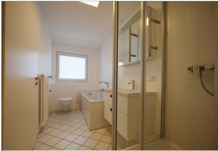
Blick ins Bad