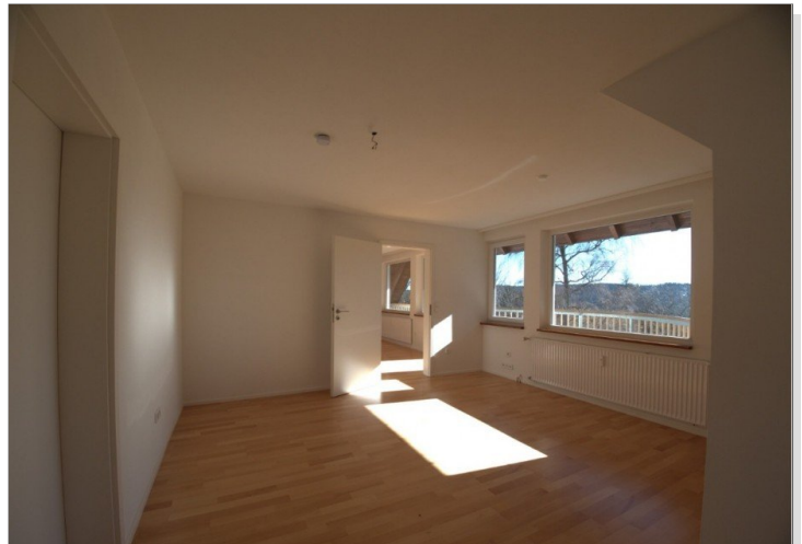
Schlafzimmer mit Tür ins Wohnzimmer