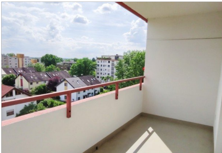
Loggia mit Ausblick Richtung Südwesten