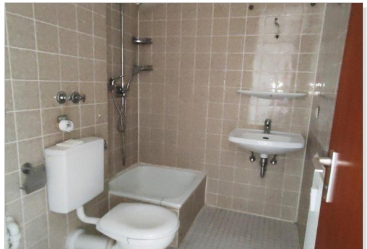
Blick ins Bad mit Dusche und Waschmaschinenanschluss