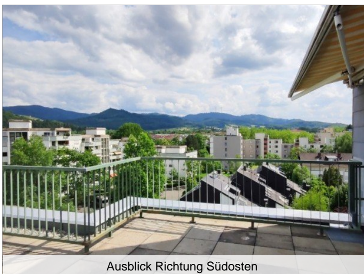
Ausblick Richtung Südosten