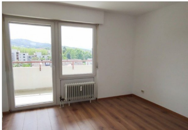
Schlafzimmer mit Loggia