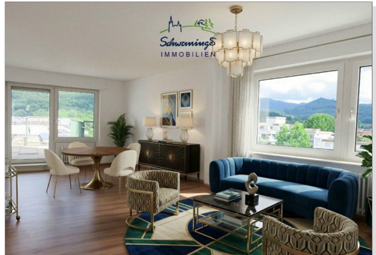
Einrichtungsbeispiel Wohn- Essbereich