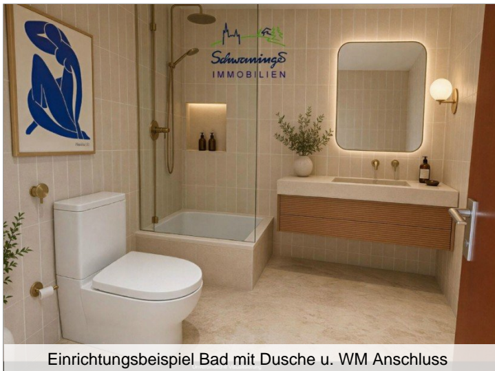
Einrichtungsbeispiel Bad mit Dusche u. WM Anschluss