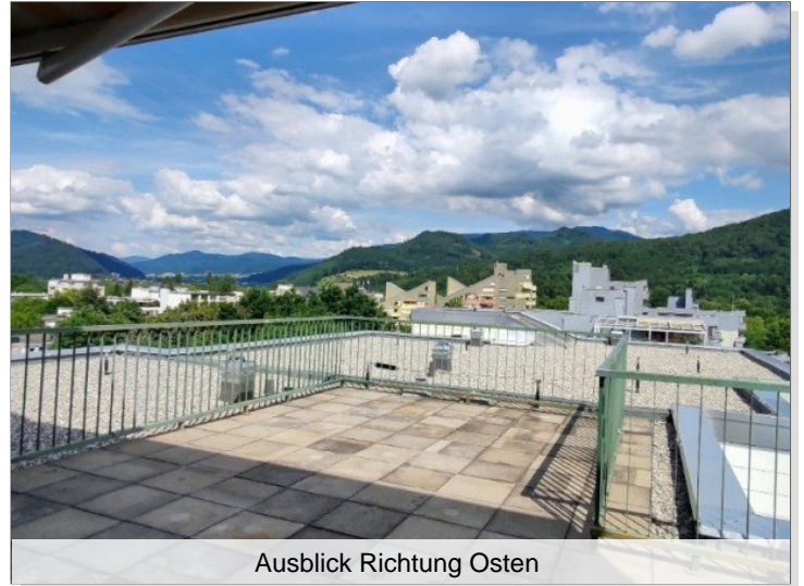
Ausblick Richtung Osten