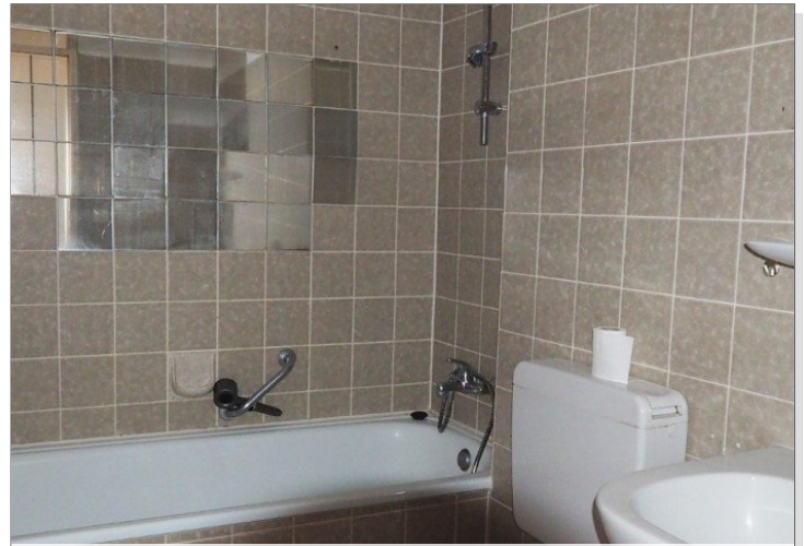
Blick ins Bad mit Badewanne