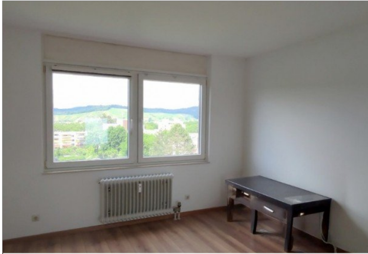
Blick ins Arbeits-/ Gästezimmer