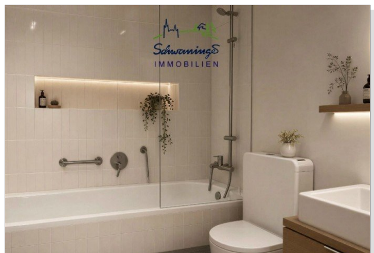
Einrichtungsbeispiel Badezimmer mit Badewanne