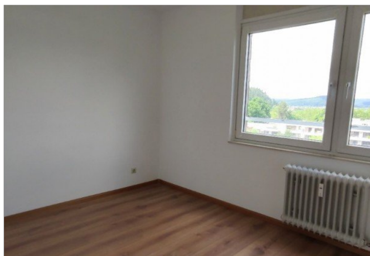
Blick ins Kinderzimmer